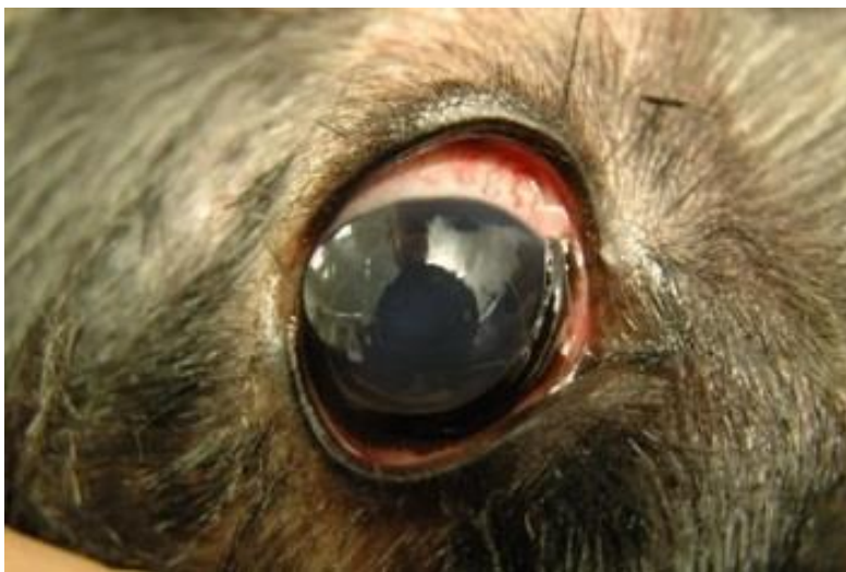
Een tibetaanse terrier met een luxatie van de lens naar de voorste oogkamer

Vooreerst zou de lens iets bolliger zijn. Daarom zou de onderzoeken de rand van de lens te zien bij oogcontrole van een verwijde pupil. Momenteel wordt onderzocht of het zien van de rand van de lens bij oogonderzoek een waarde zou hebben in verband met het kunnen voorspellen van een latere lensluxatie.